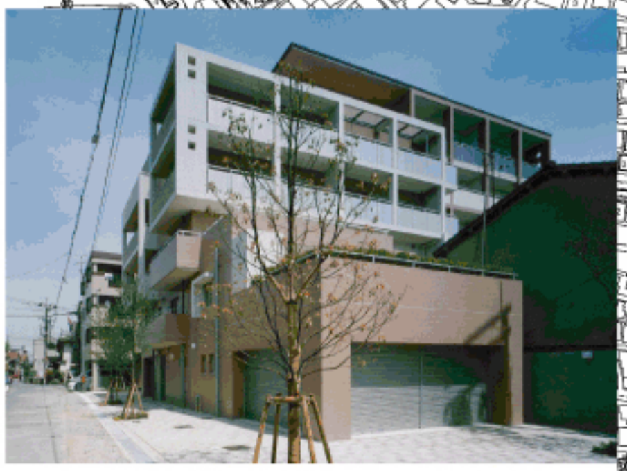
まちづくり建替例(共同)