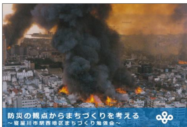
枚方土木事務所による防災講演

説明会で紹介された内容については、今後の『まちづくりニュース』でも随時紹介していきます。