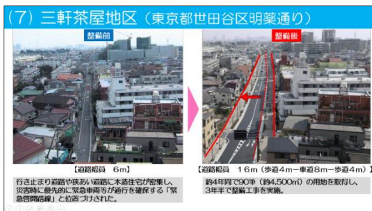
(株) UR リンケージによるまちづくりの事例紹介