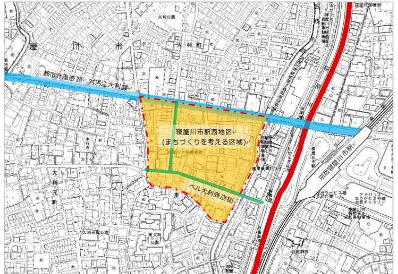
まちづくりを考えていく区域

『まちづくり勉強会』は、『寝屋川市が事業着手した都市計画道路対馬江大利線の整備によって、商店街への人の流れが変わってしまい、地域の活力が弱まってしまっているのではないかと。また、道路の沿道が用地買収され沿道の建物が建替わることを契機に、道路が狭く住宅が密集している町並みを変えていくことができるのではないかと。』という思いで、ベル大利商店街と対馬江大利線に挟まれた地域のまちづくりについて考えていくことを目的にしています。