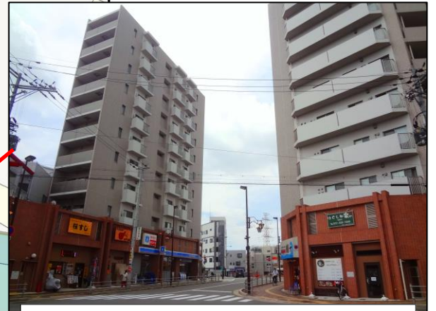
沿道のにぎわい強化や居住誘導イメージ