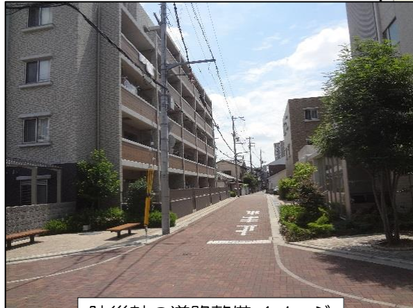
防災軸の道路整備イメージ