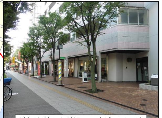
拡幅歩道と歩道沿いの店舗イメージ