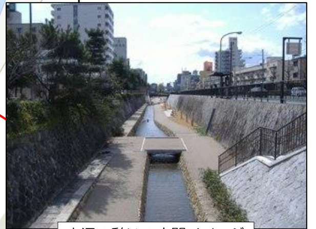
水辺の憩いの空間イメージ