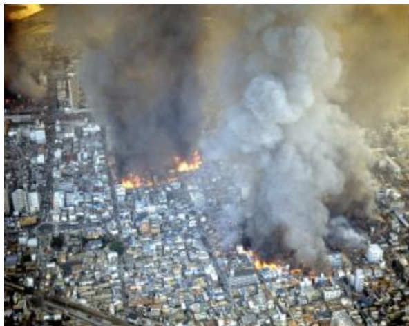
阪神・淡路大震災時の被災状況(1995年1月17日)