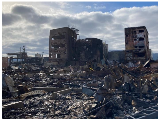
能登半島地震・輪島市朝市の被災状況(2024年1月1日)