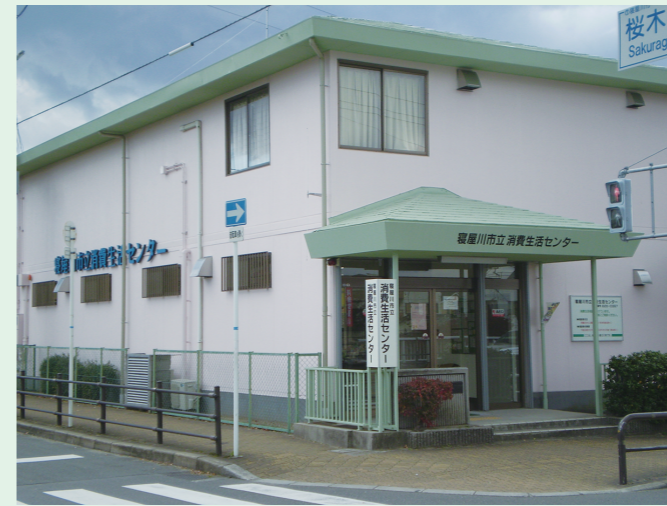
消費生活センター