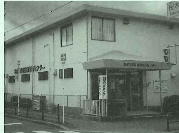
消費生活センターは桜色、屋根部分は薄緑色の2階建てです。