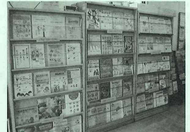
消費生活センター内には、さまざまな資料をそろえています。