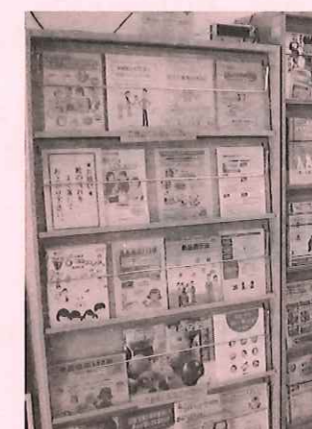
消費生活センター内には、さまざまな資料をそろえています。