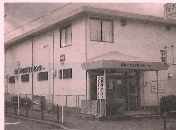
消費生活センターは桜色、屋根部分は薄緑色の2階建てです。