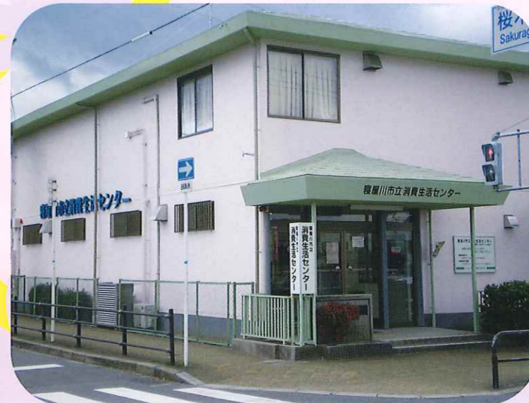
消費生活センター