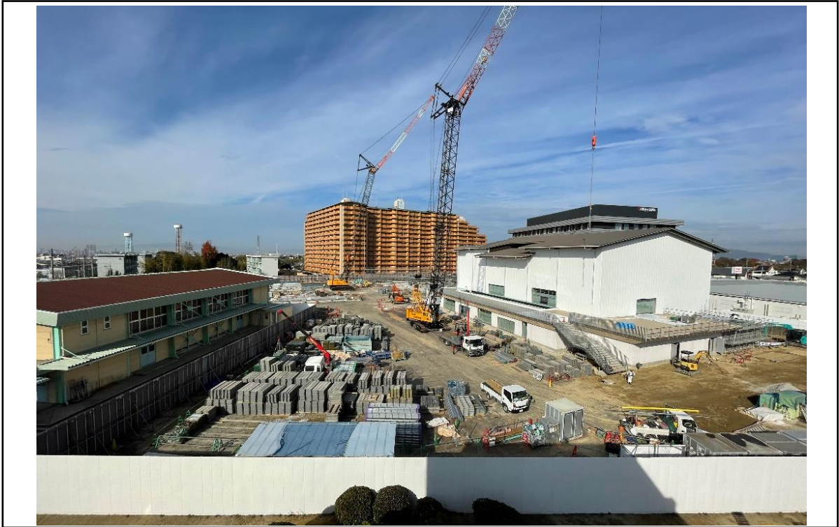
【撮影箇所】 既存校舎屋上より 【説明】 体育館棟 外装工事