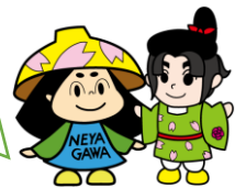
はちかづきちゃん ねや丸くん