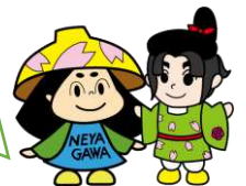
はちかづきちゃん ねや丸くん