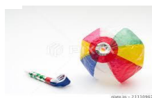
吹き戻し・紙風船