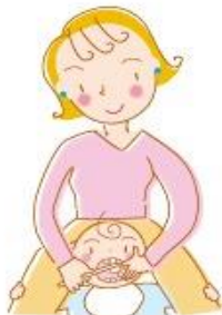
寝かせ磨きの姿勢