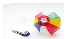
吹き戻し・紙風船