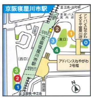
京阪バス 寝屋川市駅前内所 ☎072-826-0475