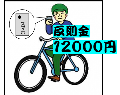
携帯電話使用等 (ながらスマホ)

信号無視や一時不停止、ながらスマホ等の悪質危険な運転は 違反となり青切符が適用されます！