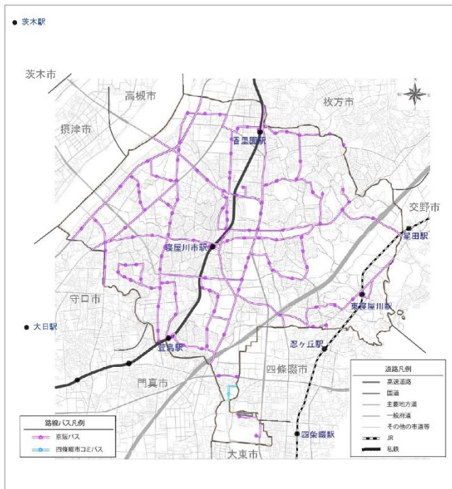
図 公共交通網の状況

そこで、本計画の将来像としては、子どもや学生、働く世代、高齢者などの各世代、また、子育てする人、障がいがある人など、「 だれもが安心・気軽に利用できる公共交通ネットワークの実現 」とします。