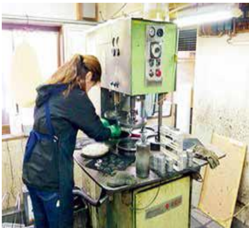
市内のモノづくり現場 (第五次寝屋川市総合計画後期基本計画より)