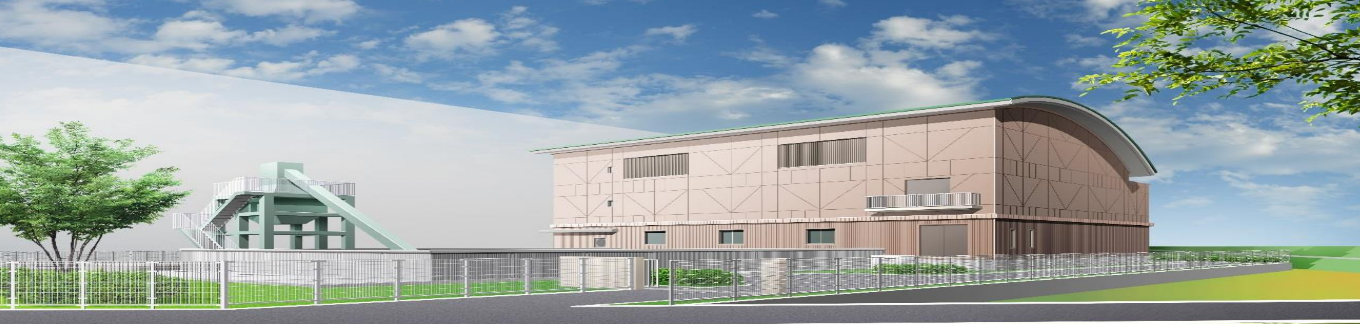
寝屋川市高宮ポンプ場（イメージ図）