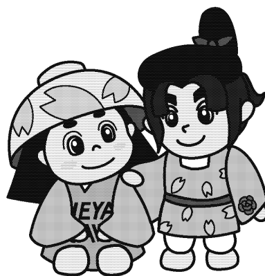
はちかづきちゃん ねや丸くん