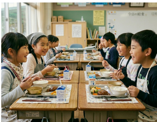
小学校給食費無償化の実施

答 国の無償化では不足する物価高騰分について、市独自の支援を行うことで、安全・安心でおいしい給食の提供を維持するとともに、更なる内容の充実に向け、品数を増やすなどの取組を進めていく。