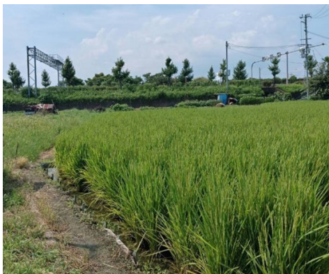
市内の農地を守ろう

問 木屋元町の24時間営業の冷凍物流倉庫の建設については「木屋地区水利支部」や「木屋地区の住環境を考える会」の要望内容を開発者に伝え、住民が心配する課題が解決できるように必要な行政指導を求める。 答 要望内容は既に開発者へ伝えており、開発指導要綱を基に指導する。