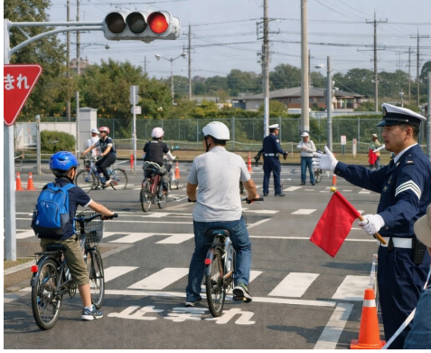
全世代への交通ルールの講習

答 より多くの保護者・子ども達と一緒に交通ルールを学べる講習会の開催が各小学校区で必要と考えるため、教育委員会、警察と協議する。