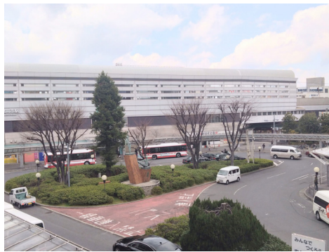
公共交通機関の結節点である 寝屋川市駅東側ロータリーの様子