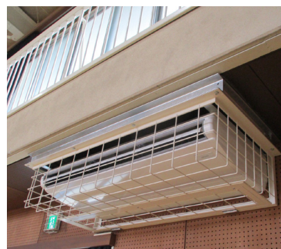
小学校の屋内運動場に設置されたエアコン

答 令和7年度には避難所となる小中学校屋内運動場のエアコン設置が完了し、令和8年度には遮熱対策等の修繕やトイレリメイク緊急3か年事業が完了するなど既存校舎等の活用を図りつつ公共施設全体の在り方を整理し取組を加速させたいと考える。