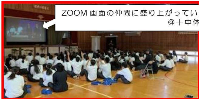
ZOOM 画面の仲間に盛り上がっています。 @十中体育館