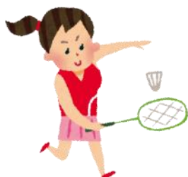
男子バドミントン・女子バドミントン