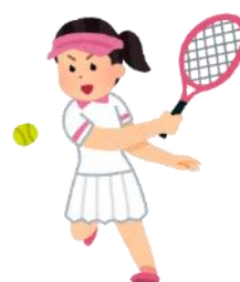
男子テニス・女子テニス