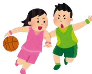
男子バスケット・女子バスケット