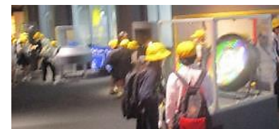
4年 大阪市立科学館