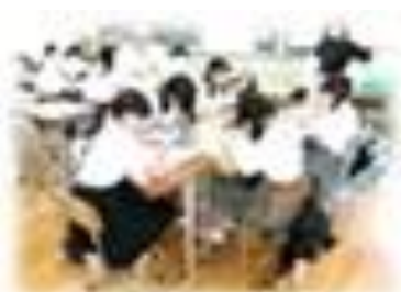
二中クラブ体験 美術