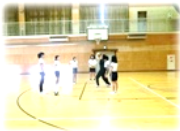
二中クラブ体験 バレーボール

今日から始まる2学期は、運動会や林間学校、修学旅行など大きな行事が続き、1年で一番長い学期です。目標をしっかりとって、終わった時に「頑張った！やり切った！」と言える充実した時間を過ごしてくれることを期待しています。