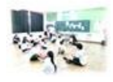
双葉学園 小中ハートプログラム