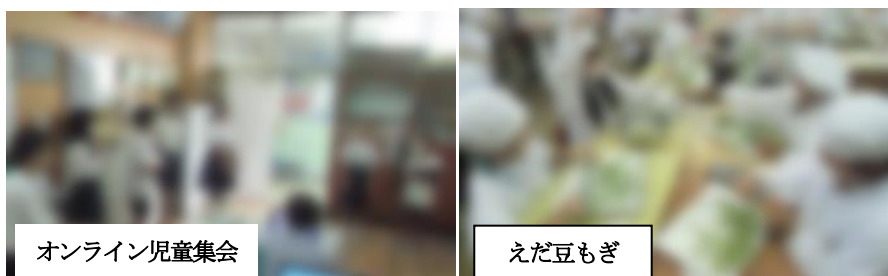
オンライン児童集会