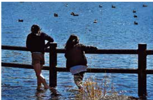
昨年度の市長賞作品