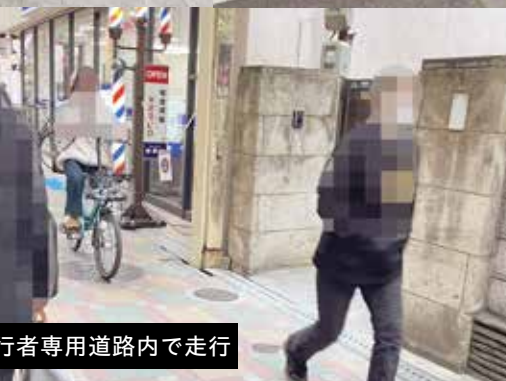
歩行者専用道路内で走行