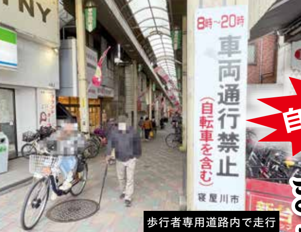
歩行者専用道路内で走行