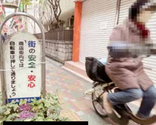
歩行者専用道路内で走行