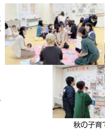
秋の子育て応援フェア

全ての市立幼稚園、小・中学校で「学校園閉庁日」を設定します。みなさんの理解と協力をお願いします。