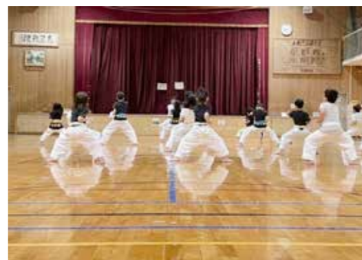
池の里クラブ(空手教室)