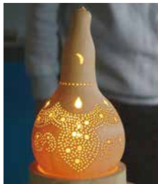
ひょうたんランプ