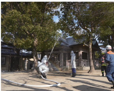
昨年度の様子(文化財防火デー)

ら守るために行います。 時 1月25日(日) 午前10時～11時 所 本信寺(木屋元町) 内 ①寝屋川消防署・市消防団による消火訓練 ②火災・震災時の心がまえや避難、初期消火についての説明と消火器の使い方の講習 ③市職員による周辺の文化財についての説明 他 駐車場はありません HP 7731 問 文化スポーツ室(☎813・0074)