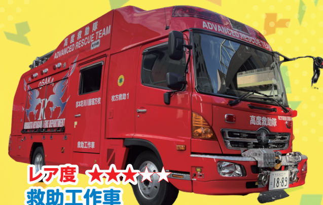
レア度 ★★★★★ 救助工作車 人の命を救うスペシャリスト、救助隊員が乗ります！