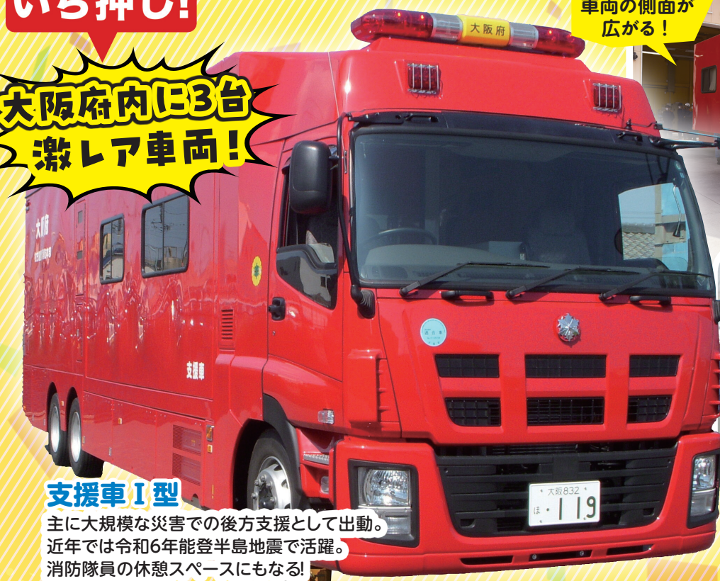
支援車Ⅰ型 主に大規模な災害での後方支援として出動。近年では令和6年能登半島地震で活躍。消防隊員の休憩スペースにもなる！