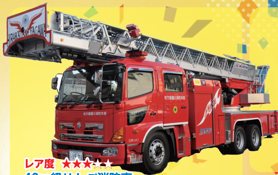
レア度 ★★★★★ 40m級はしご消防車 ビル13階分の高さまではしごを伸ばせます！