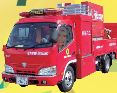
レア度 ★★★★★ 大量送水車 1分間に4,500リットル（お風呂23杯）の水を送水・排水！