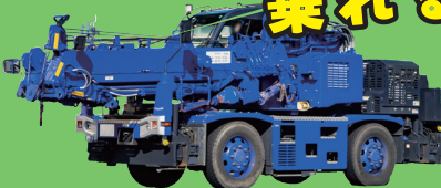
ラフテレーンクレーン 大きなクレーンで重いものを持ち上げます！