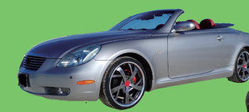
オープンカー パレードの先頭を行く気分を味わおう！