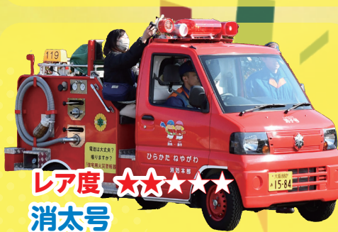
レア度 ★★★★★ 消太号 子ども用広報車。後部座席では手動でサイレンを鳴らせます！