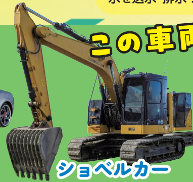
ショベルカー 土砂災害などの大災害に大活躍！