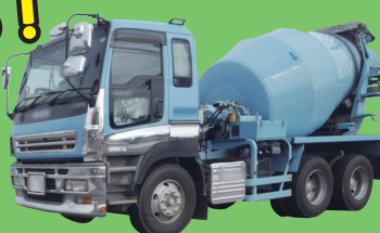
ミキサー車 災害時は消火水を搬送します！