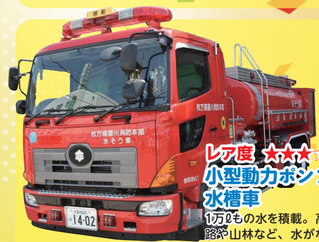
レア度 ★★★★★ 小型動力ポンプ付水槽車 1万2千リットルの水を積載。高速道路や山林など、水がない場所で活躍！