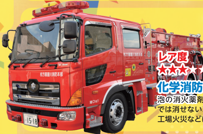
レア度 ★★★★★ 化学消防車 泡の消火薬剤を搭載。水では消せない車両火災や工場火災などに！