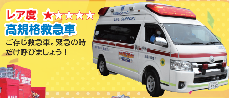
レア度 ★★★★★ 高規格救急車 ご存じ救急車。緊急の時だけ呼びましょう！