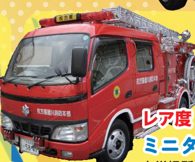
レア度 ★★★★★ ミニタンク車 火災場所に一番近いで消火活動します！