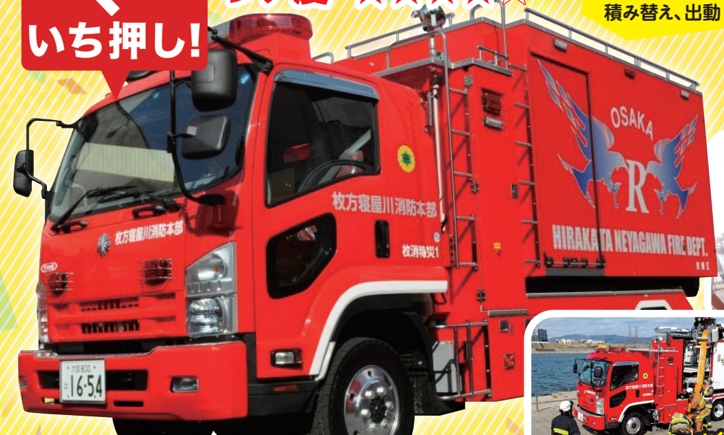
特殊災害対応車（支援車Ⅱ型） 今回は1km先まで送水できる大型ホースを搭載！