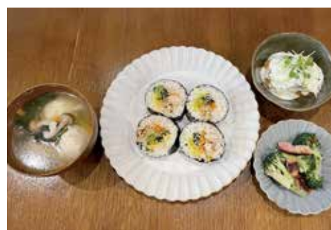
親子deわくわくクッキング

市内飲食店と市の管理栄養士による料理教室を開催します。おいしく適量なヘルシー料理を一緒に作りましょう。