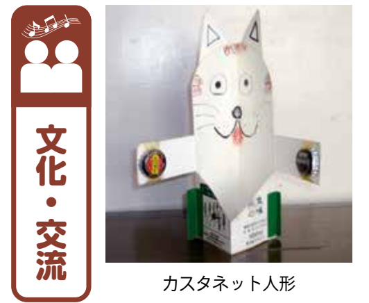
カスタネット人形

△大人自然工作シリーズ講座 ストーンアート▽ 時 1月19日(金) 午前10時～正午 内 石ころに絵を描きます 対 18歳以上 定 20人(申込順) △幼児と保護者の自然教室 カスタネット人形▽ 時 2月10日(土) 午前10時～正午 内 牛乳パックを使って作ります 対 幼児と保護者 定 10組(申込順) ※ 申 自然体験学習室(市立中央図書館西分室内) 料 無料 HP3369 申 1月6日(土) から直接又は電話で市自然資料施設運営スタッフの会(市立中央図書館西分室内 ☎39・6882)