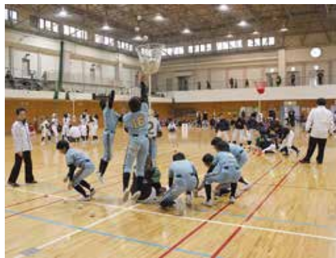
寝屋川チャンピオンCup