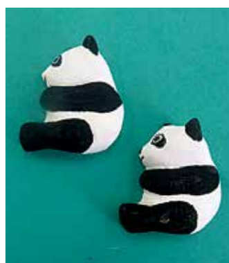
パンダのブローチ

以上の人 ※ 市立中央図書館西分室内自然体験学習室 定 20人(申込順) 料 無料 HP 3369 申 9月2日(土) から直接又は電話で市自然資料施設運営スタッフの会(市立中央図書館西分室内 ☎39・6882)