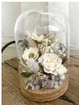
フラワーアレンジメント

①やさしいパンづくり 時 9月20日(水) 午前10時～午後1時 対 シュガートップバターレーズンパン作り ②フラワーアレンジメント～ガラズドームの中の小さなガーデン～ 時 9月24日(日) 午前10時～正午 対 プリザーブドフラワーやドライフラワーを使ったアレンジメント