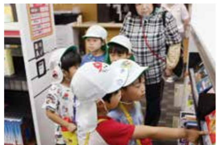
図書館探検事業の様子

～子どもが絵本を好きになることで親子の会話が増え、絵本の読み聞かせをとおして親子の絆が深まる～これは市の職員から教えていただいたことです。近年、大人も子どもも本にふれる機会が減少していることが問題視される中で、このような事業の存在は大きな意味を持つと感じました。イベントをきっかけに絵本の魅力に気付き、図書館を日々のよりどころにしてくれる親子が増えることを願っています。