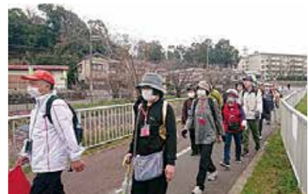
市民ウォーキング

市民ウォーキング 秋分の日(野崎観音(慈眼寺)へGO!) スポーツ推進委員といっしょに歩いてみませんか。 時 9月23日(祝) 午前9時出発～正午頃解散(受付は午前8時30分から、時間厳守) 所 市役所玄関前集合 対 市役所→深北緑地→野崎観音の約8kmのコースと深北緑地でゴールし、そのまま遊べる約5kmのコースがあり、いずれも現地解散 対 市内在住・在職・在学の人(子どもと一緒に参加も可) 定 200人(先着順) 料 無料 他 参加賞あり HP 16998