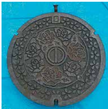
下水道マンホール蓋

▽マンホール蓋の状態 ①直径約60cm、重さ約40kg②実際に使用した下水道用マンホール蓋で錆・傷が多数あります③マンホール蓋の表面や裏面には凸凹がありますので、平らな