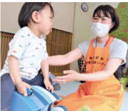
子育て応援リーダー

安心して子育てができるようにサポートする、子育て応援リーダーを募集します。 時下の表のとおり 所 リラット(市立子育てリフレッシュ館) 内 市主催事業での一時保育・保育所などの子育て支援事業のサポート・乳幼児健康診査会場でのサポートなど 対 市内在住・在職・在学中で子育て支援に関心のある又は子育て支援に携わっていた20歳以上の人 定 30人程度 他 養成講習会を全て受講することが必要、一時保育を行います(3か月・就学前の子ども5人(申込順)、9月29日(金)までに予約) HP17700 申 9月29日(金)までに直接窓口又は電話で子育てリフレッシュ館(☎00・3885)