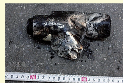
火災原因となったスプレー缶

火災の原因となるスプレー缶やリチウムイオン電池、ライター、充電式小型家電などの正しい分別に協力をお願いします。 ※分別方法や排出方法などはクリーンセンターや市公式アプリなどで確認してください。