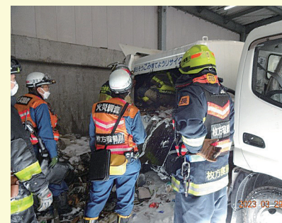
枚方寝屋川消防組合による消火活動