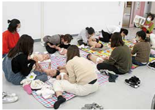
まちのせんせい体験講座

子どもの学力向上を図るため、土・日曜日や長期休業期間などの学校休業日に市立各小・中学校で開催しています。一人一人に合わせた学習計画で、分からないところは講師がサポートしながら学習を進めます。