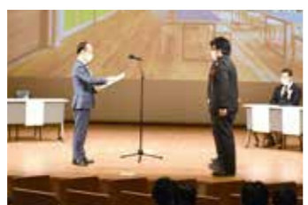
「第2回ねやがわ建築賞」授賞式の様子

私たちの生活に必要な不可欠である家や学校、会社の建物は、暮らしをよりよくするためのいろいろな思いや工夫、仕掛けが投影された「モデル」であると今回の取材を通して感じる事ができました。