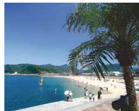
和歌山県すさみ町

市内在住・在職・在学の皆さんがすさみ町内で利用できる宿泊利用補助制度を設けています。ぜひ、すさみ町を訪れてみてください。 ▽補助額 1泊2食付き以上(1人に付き)：大人2000円～2500円・子ども1500円～2000円 ※宿泊先で異なります 申 宿泊施設に直接予約後、宿泊日の前日までに市民活動振興室又はねやがわシティ・ステーション ※旅行総合サイトや旅行代理店での予約のときは、利用できません。他のクーポンとの併用はできません。詳しくは問い合わせてください。