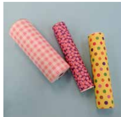
キラキラスコープ