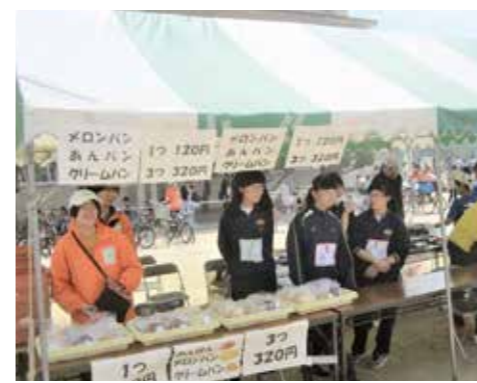
池の里クラブまつり

池の里クラブ ハスポーツ教室無料体験 時 ①親子教室:4月11日・18日、いずれも火曜日午前9時45分〜10時30分 ②走り方教室:4月22日(土)午前11時15分〜正午 対 ①1歳6か月〜就学前の子ともと保護者②小学生 定 ①各日5組②15人(申込順) 内 ①親子でふれあいながら楽しく運動遊び②走り方を改善し、スポー