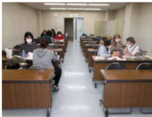
日本語よみかき学級

時 4月12日(水) からの毎週水曜日 ①午後2時～4時 ②午後6時45分～8時45分(いずれも計44回の予定)