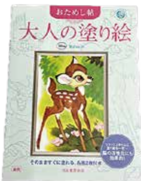
「大人の塗り絵」で ほっこり癒し時間

△大人の塗り絵で ほっこり癒し時間 時 2月23日(祝) ①午前10時～正 午②午後1時～3時 所 アルカス ホール会議室2 内 塗り方のコツ を教わりながら塗り絵を楽しみます ¥ 500円 定 各回10人(申込順) 他 色鉛筆と教材(河出書房新社お ためし帖)を用意しています ※詳しくは「アルカスホール」ホー ムページ又はチラシを見てくださ い。 申 1月10日(火) から直接又は 電話でアルカスホール(☎821・ 1240)