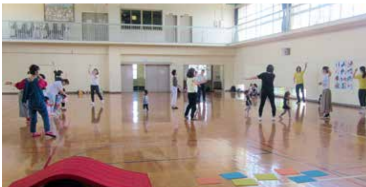
池の里クラブ 親子教室無料体験

△親子教室無料体験▽ 時1月10日・17日、いずれも火曜日 午前9時45分〜10時30分 内親子でふれあいながら楽しく運動遊び 対1歳6か月〜就学前の子どもと保護者 定各5組 他上靴を持って動きやすい服装で参加 申問電話又はホームページで池の里クラブ事務局(☎839・7004)