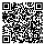
市公式 LINE QR コード