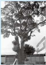
高架工事前のくすのき

昭和47年～55年の高架工事の際、それまでの駅を拡幅する形で進んだ新駅建設予定地に、萱島神社のご神木であるくすのきがあったため当初は伐採される予定でした。しかし古くから親しまれてきたくすのきを、保存できないかという周辺住民からの要望を受け、くすのきを残す形で現在の萱島駅が完成。全国的にも珍しい大木と共存する駅舎になったのです。