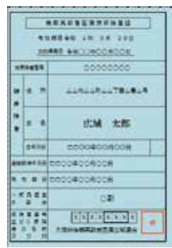
後期高齢者医療被保険者証

新しい「後期高齢者医療被保険者証」Ⅱ写真Ⅱを7月下旬までに送付します。届いたときから9月30日(金)まで使用できます。 ※10月1日(土) から使用できる被保険者証は、9月中に送付します。 HP 3592