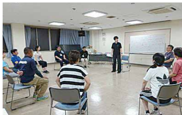
スポーツインストラクター養成講習会