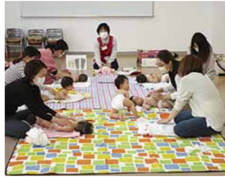
まちのせんせい体験講座 「ベビーマッサージ」

いずれも木曜日午前10時30分～11時30分 所 市立エスポアルふれあいの部屋 内 スキップで子どもの発達を促します 対 生後1か月健診後～1歳 定 10組 料 1回500円(オイル代) 他 バスタオルが必要 HP 8535 申 問 直接窓口又は電話で社会教育課(☎813・0076)