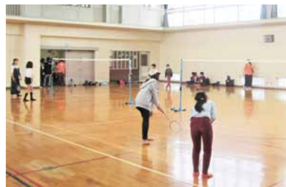
池の里クラブまつり

※バドミントンと卓球は用具を貸し出しますので、自由に楽しんでください。雨天時は屋外種目は中止。