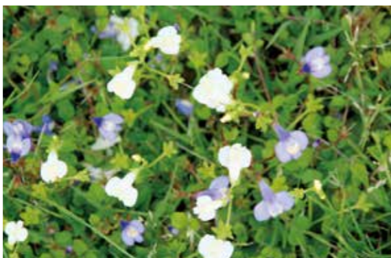
春の野草ウォッチング