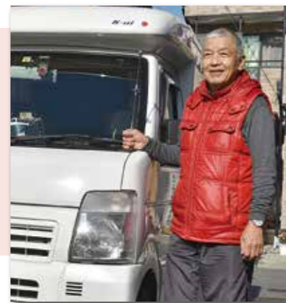
愛車のキャンピングカーと

この2月も4度目となる北海道の旅を予定していましたが、コロナ禍による緊急事態宣言で断念。「気兼ねなく出掛けられる日があるといい」と、コロナ禍の収束を心待ちにしています。