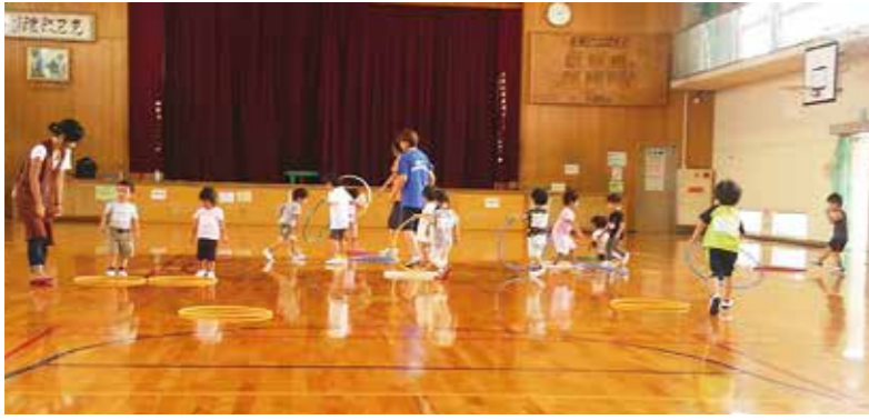
池の里クラブ 前期スポーツ教室

〓前期スポーツ教室〓 4月〜9月、教室名などは下の表 のとおり、スポーツインストラク ターや各種目専門の指導で楽しくス ポーツの基礎を学びます、市民優先 (市外の人も参加可)。