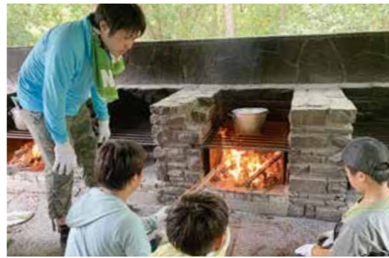
寝屋川リーダーズ小学生クラブ キャンプ活動の様子(令和元年度)

△小学生クラブ②中学生クラブ 社会体験・ボランティア活動を通して、自主性・協調性や責任感を育て、幅広い知識や豊かな感性を養います。