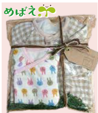
小さく生まれてきた赤ちゃんへ贈り物

市で生まれる赤ちゃんの約1割が小さく生まれます。戸惑いや不安が多い子育てのなか、「小さく生まれた赤ちゃん」とママ・パパが笑顔で過ごせる時間を手伝えたい」と、地域の子育てを応援する「NPO法人芽