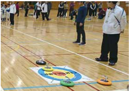
市カローリング大会

※新型コロナウイルス感染症拡大防止のためチームでの申し込みとし、個人参加はできません。詳しくは市ホームページ「文化スポーツ室」を