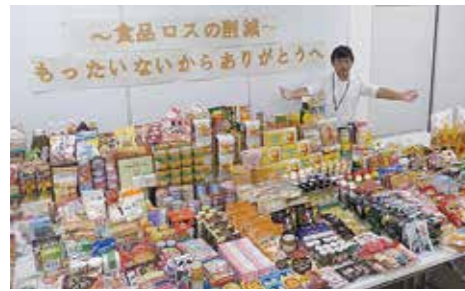
フードドライブ活動で集まった食品

市で1年間に出る可燃ごみのうち、6・9%が手付かずの食品（平成28年度ごみ分析調査）です。買い過ぎないように冷蔵庫を整理したり、食べ残しをしたりしないなど、食品ロス削減の協力をお願いします。 環境総務課（☎824・0911）