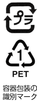
PET 容器包装の識別マーク

ペットボトルやプラスチック製容器包装などの廃プラは分別してリサイクルできます。分別せずに可燃ごみとして出すと、焼却費用がかかるだけでなく、焼却時に生ごみなどの約150倍の温室効果ガスが発生するほか、リサイクル資源が減少するなど、環境にとって良くないことがたくさん起こります。廃プラには識別マーク（左の図のとおり）が記載されているので、他人事と考えずに、きちんと分別し、指定された曜日に出してください。