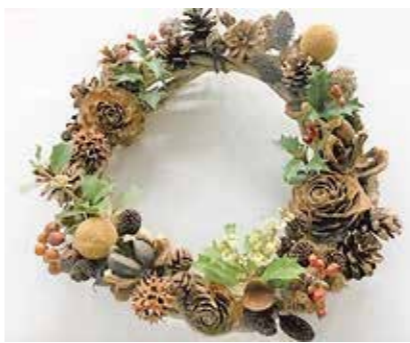
クリスマスリース