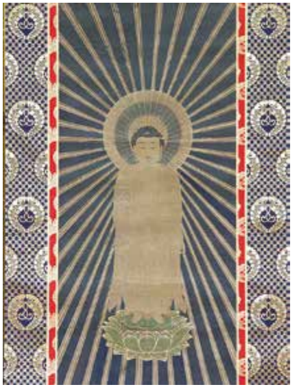
絹本着色方便法身尊像