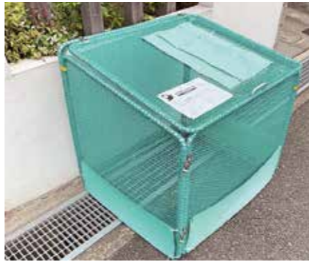
折り畳み式箱型ネット

▽対象 市の区域内でごみ集積所を管理する自治会など ▽補助金額 箱型ネットの購入価格(税抜き)の2分の1の額(1個当たりの限度額1万円) ▽申請書の配布 市クリーンセンター、市民活動振興室、各シティ・ステーション又は、市ホームページ「環境総務課」からダウンロードできます。 ※①購入前に補助金の交付申請をしてください②ごみ集積所1か所につき1回限りです。