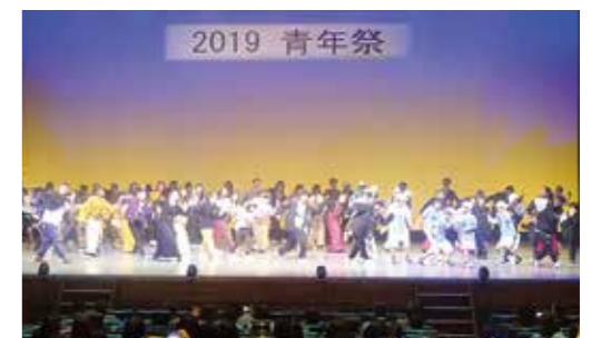
昨年の青年祭の様子