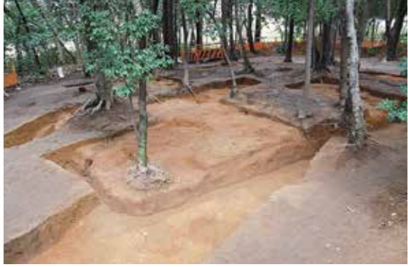
国史跡高宮廃寺跡