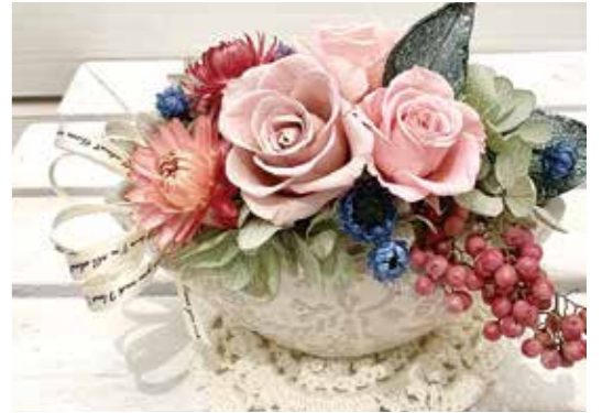
プリザーブドフラワーアレンジメント