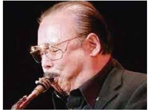
サクソスジャズコンサート