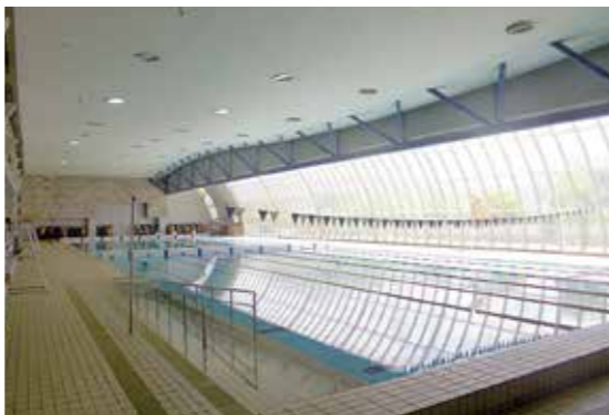
門真スポーツセンタープール

骨粗しょう症予防教室 ～骨からキレイになる講座～ 7月29日(水) 午前10時～11時30分(受付は午前9時30分から)、市立保健福祉センター5階研修室5・多目的ホール、20歳以上の女性24人(申込順)、筆記用具を持って来てください、参加無料。 ※受付で体温など体調確認を行いますので早めに来てください。 ◎一時保育を行います(6か月～就学前の子ども3人(申込順)) 申込・問 直接窓口又は電話で健康づくり推進課 (☎812・2002) ヘルスアップ教室 7月27日(月) 午後1時30分～3時30分(受付は午後1時から)、市立保健福祉センター4階健康指導