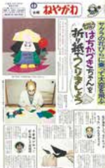
▲平成5年当時の広報

大手家電メーカーに勤めていた50歳の頃に折り紙と出会い、退職後は「折り紙を楽しみましょう」をキャッチフレーズに市立児童会館などで折り方を教えました。寝屋川市のマスコットキャラクター「はちかづきちゃん」の折り方も考案し、80歳で亡くなるまでに動物など数多くの作品を創作。外国語版も含めて本を10冊出版し、世界の人々に楽しさを伝えました。