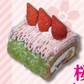
桜のロールケーキ