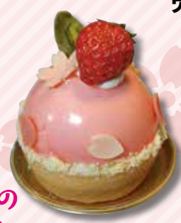
サクラのタルトケーキ