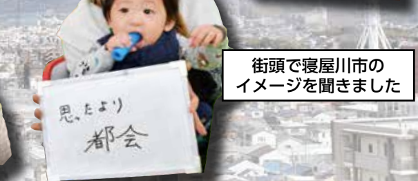
街頭で寝屋川市のイメージを聞きました