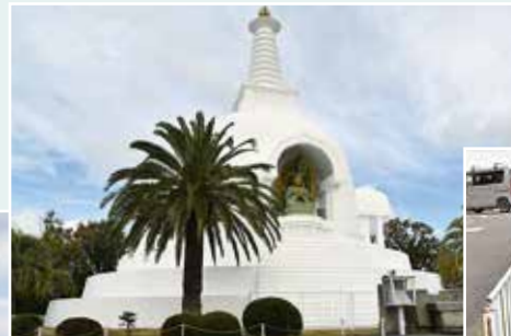
大阪仏舎利塔 (成田東が丘) 白くて大きくてインパクトがある (20代)

国指定文化財「石宝殿 (いしのほうでん) 古墳」の近く。見晴らしがよく、あべのハルカスや、空の澄んだ日は明石海峡大橋も見えます (70代以上)