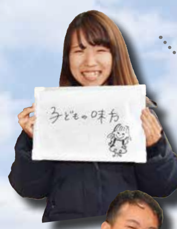
図 企画三課 (☎813・1146)

市内のおすすめスポットは? あなたが思う寝屋川市の自慢は? 皆さんが寝屋川市についてどう思っているかを街頭インタビューやインターネットで310人に聞きました! あなたのオススメはランキングに入っているかな? アンケートの御協力、ありがとうございました!