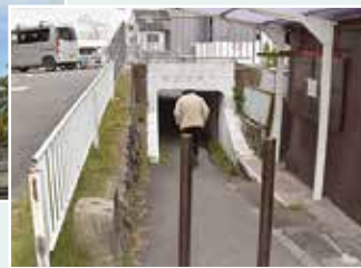
低すぎるトンネル (寿町) 成人男性はかがまないと通れません (30代)