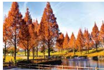
メタセコイアがオススメ!