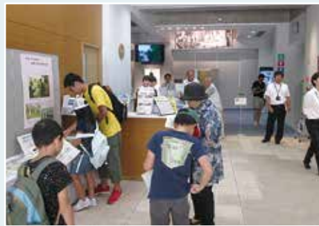
昨年度の平和バスツアー

参加者氏名、年齢、学年、電話番号(返信はがきにも郵便番号、住所、氏名)を書いて7月17日(水)に消印有効にまで人権文化課(〒572-8555本町1番1号) ☎825・2168)