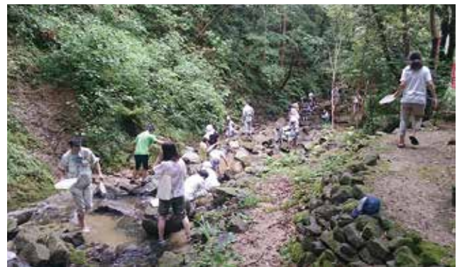
親子で見る自然散策と水辺の生物観察