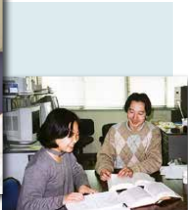
大学時代の在間さん(左)

4月には1年ぶりに教育委員会から中学校の現場へ。結び目理論は今やゲームや医療分野の研究にも応用されており、「こんな話題をきっかけに少しでも算数や数学に興味を持ってくれたら」と願い、今日も教壇に立っています。