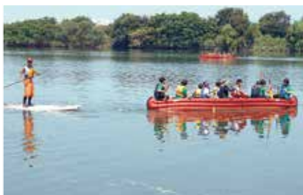
淀川まるごと体験会