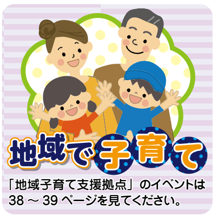
図 市立エスポアール（☎828・4141）