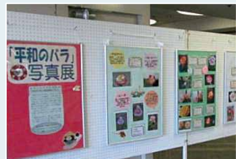
「平和のばら」写真展