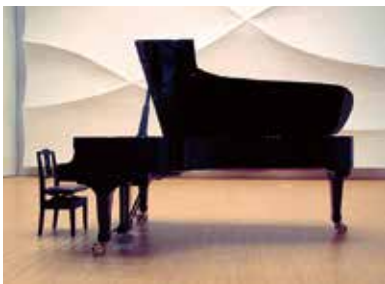
アルカスジュニアピアノコンクール募集部門

申込 指定銀行口座へ参加費を振り込み後、所定の用紙(アルカスホールホームページからダウンロード)に振込証明書類を添付して、直接窓口又は郵送で8月16日