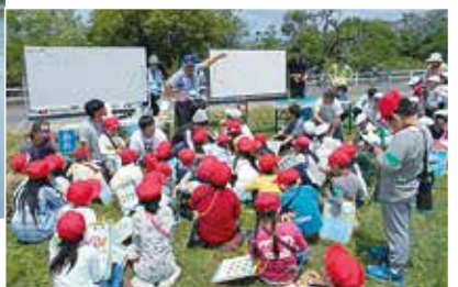
点野小学校1年生校外学習